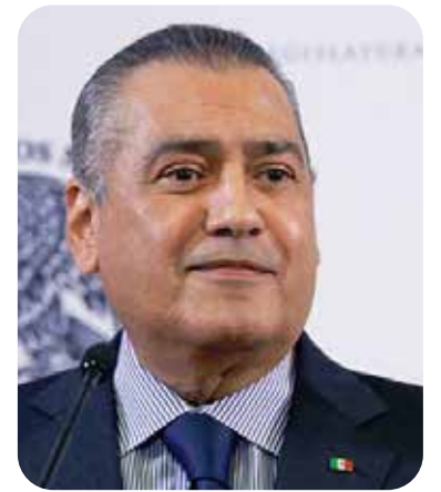
Manlio Fabio Beltrones