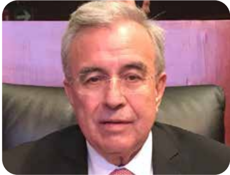
Rubén Rocha Moya