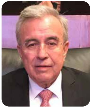
Rubén Rocha Moya